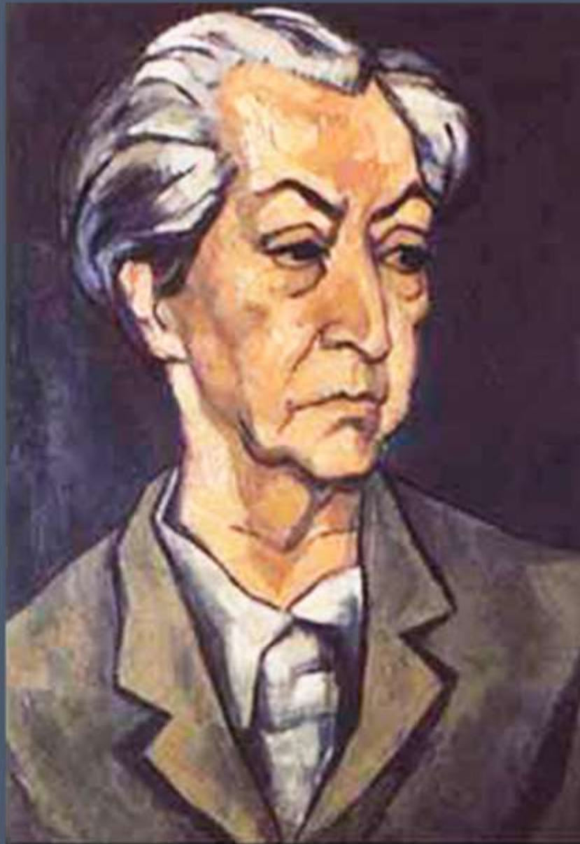
Gabriela Mistral Gabriela Mistral de Oswaldo Guayasamin