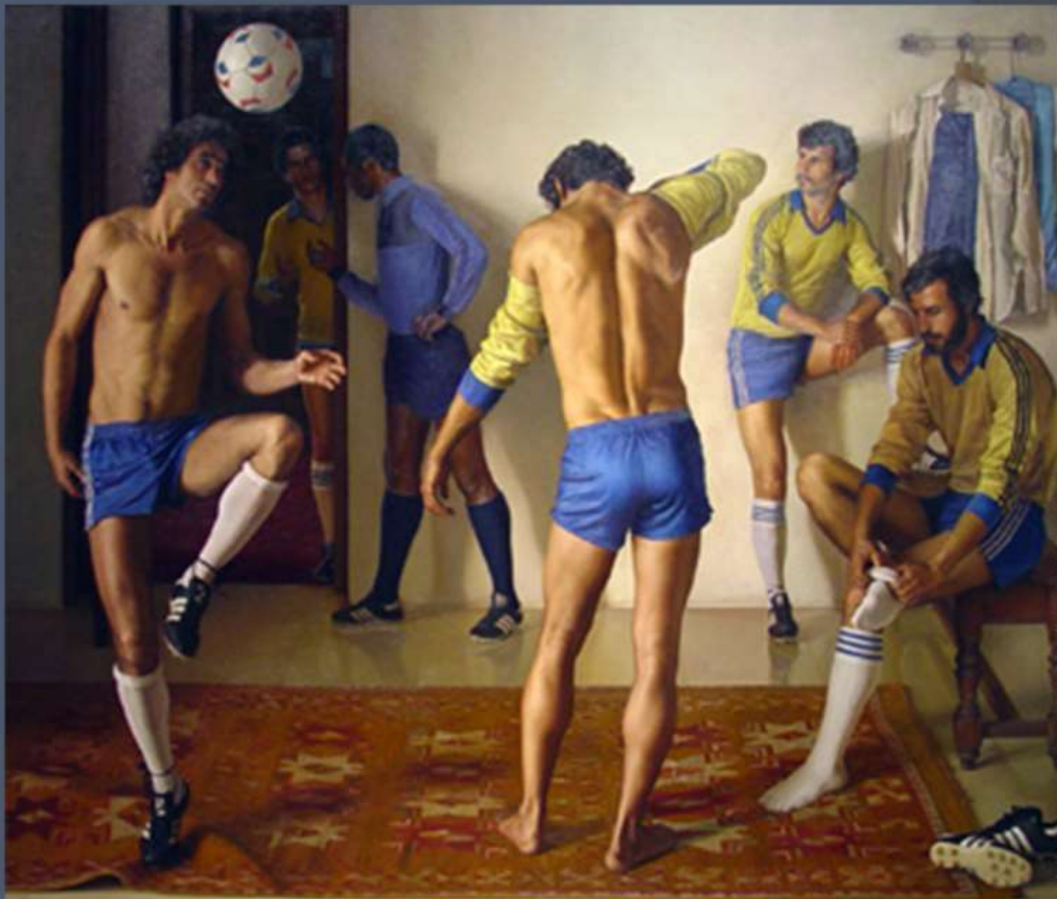
Antes del partido de Claudio Bravo