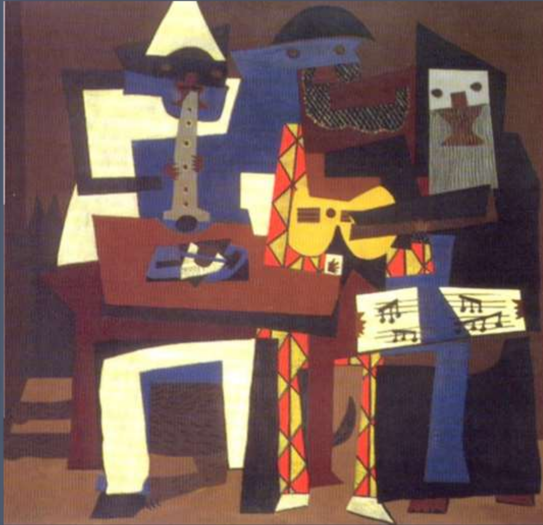
Los Músicos de Pablo Picasso